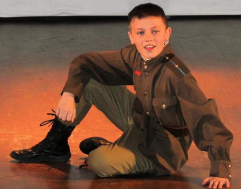
Творческое объединение: Театральная студия «Прометей»